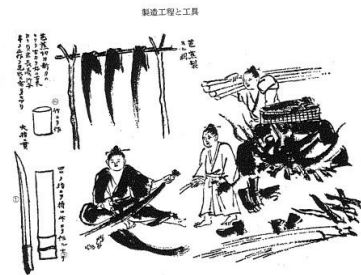
*挿絵で見る「南島雑話」より